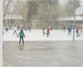
يلعب الطلاب في الخارج في يوم دراسي تلجي

Visit psdschools.org to see the full 2023-24 calendar.>>