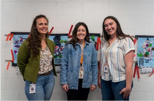
معلمات من مدرسة باتنام الابتدائية